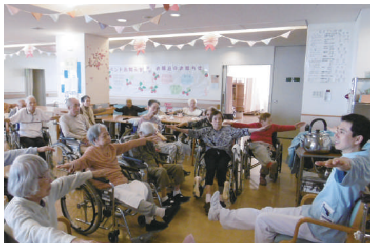
介護老人保健施設 えきさい大阪 いきいき百歳体操

介護老人保健施設において介護、機能訓練その他必要な医療のほか、介護の相談・支援なども行っています。