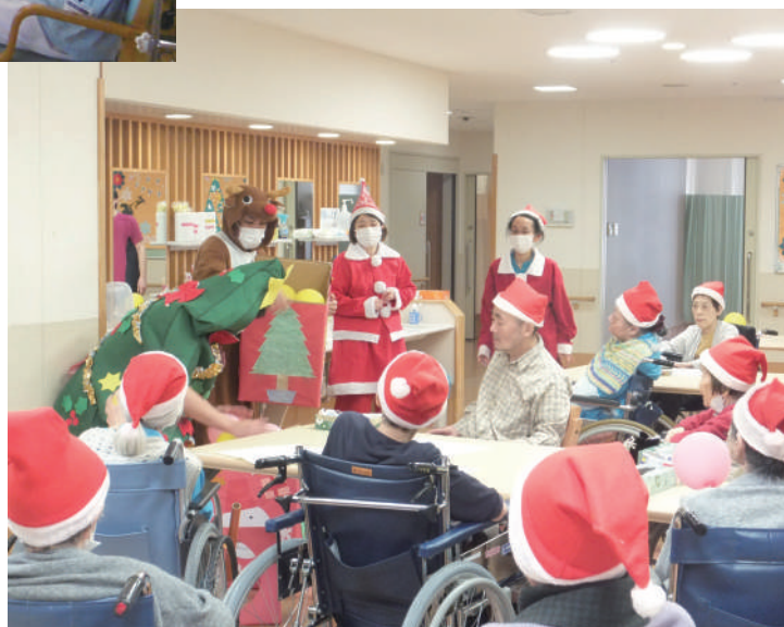
介護老人保健施設 えきさい横浜 クリスマス会