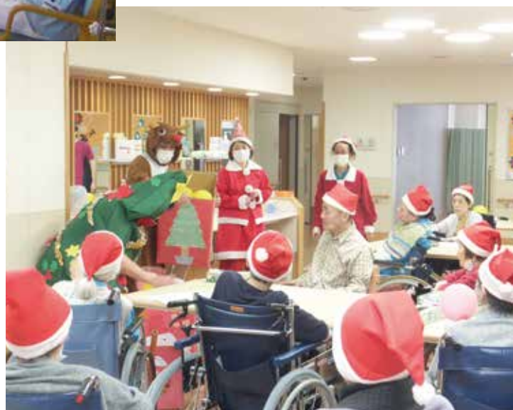
介護老人保健施設 えきさい横浜 クリスマス会