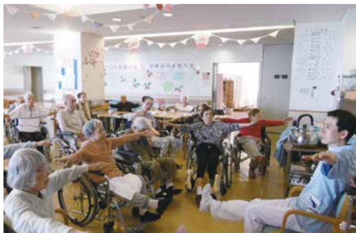
介護老人保健施設 えきさい大阪 いきいき百歳体操

介護老人保健施設において介護、機能訓練その他必要な医療のほか、介護の相談・支援なども行っています。